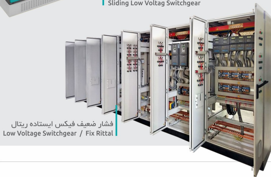
فشار ضعیف فیکس ایستاده ریتال Low Voltage Switchgear / Fix Rittal