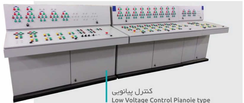
کنترل پیانویی Low Voltage Control Pianoie type

پروژه کوره به جاسک - شرکت مهندسی و توسعه نفت پروژه پالایشگاه جنوبی میعانات گازی آدیش مجموعه تابلوهای گروه‌های مینا کارخانه تغلیط مس در آکو پتروشیمی صدف هلدینگ خلیج فارس کنساتره سنگ هماتیته رضوان شهر مجتمع مس میدوک-کرمان فولاد جهان آرا اروند مجتمع مس سرچشمه مجتمع مس سونگون گل گهر سیرجان